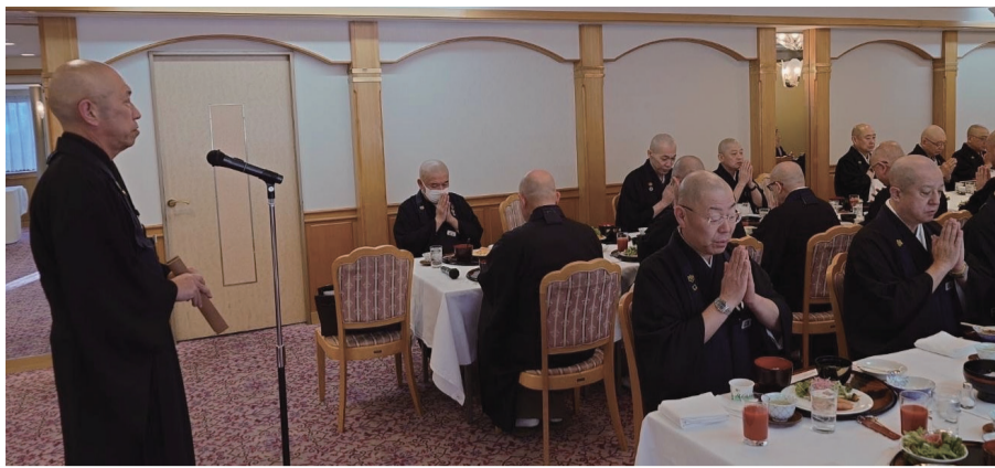
議会中の朝食風景

総括質問が終わると、特別委員会の委員が指名され議案の付託が行われます。これより以降は、各議員からの通告での質問の日程の合間を縫って委員会が開催され、委員会の中では古参・新人にかかわらず積極的な意見や質問が行われ、担当部署の部課長はそれぞれの委員会に呼ばれて詳細な説明を求められます。